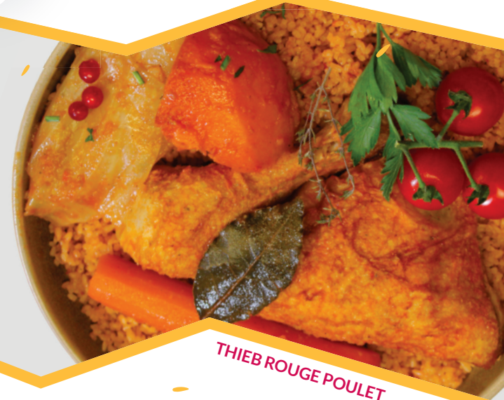
THIEB ROUGE POULET

7J/7 Du Lundi au Dimanche De 11h30 à 14h30 puis 18h30 à 22h30