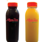
JUS DE BISSAP JUS DE GINGEMBRE